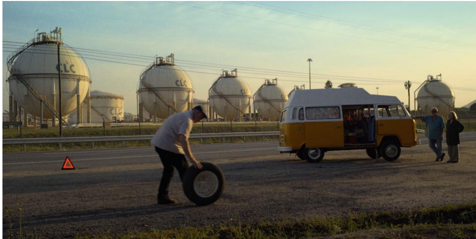
Imagem: Prazer, Camaradas!