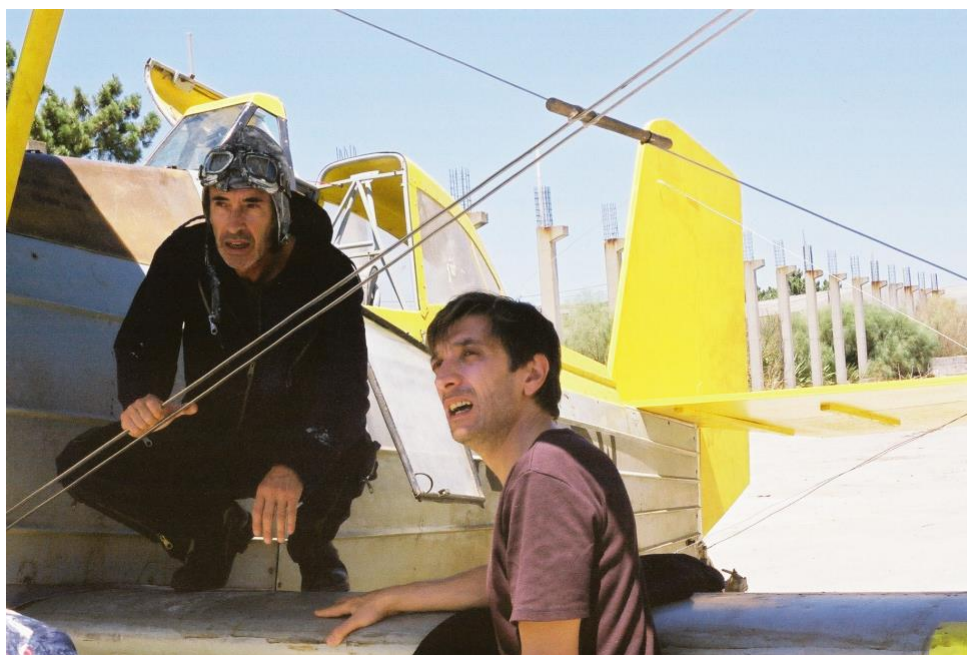
Imagem: Aparelho Voador a Baixa Altitude

Em parceria com a Universidade de Edimburgo e o MotelX