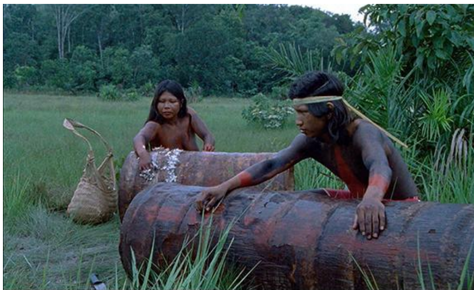
Imagem: Chuva e Cantoria na Aldeia dos Mortos

Portugal/Brasil 2018 Dir João Salaviza e Renée Nader Messor 114'